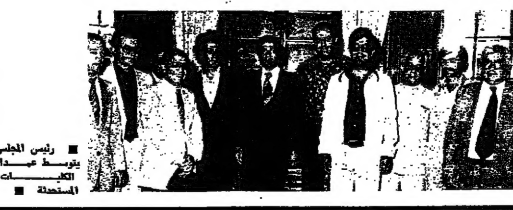
رئيس المجلس يرأس عبيد الاستهلاكية